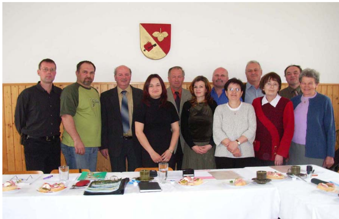
Partnerregion Lauener Unterwald (CZ)

Informationsveranstaltung ILE 26.05.2008