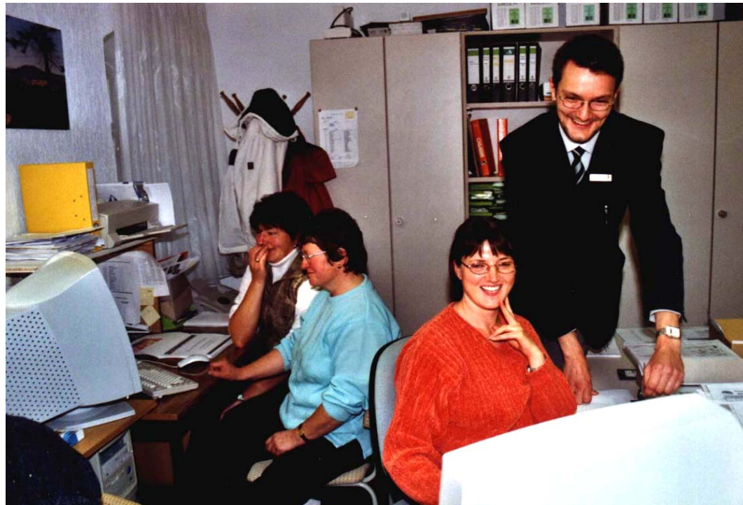
PC-Grundkurse für Anfänger