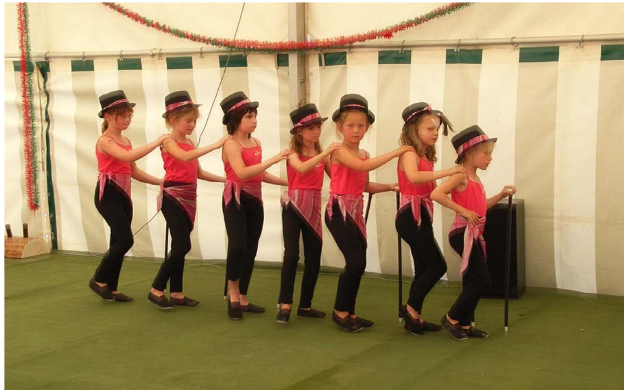
Die Jugend aktiv mitgestalten lassen