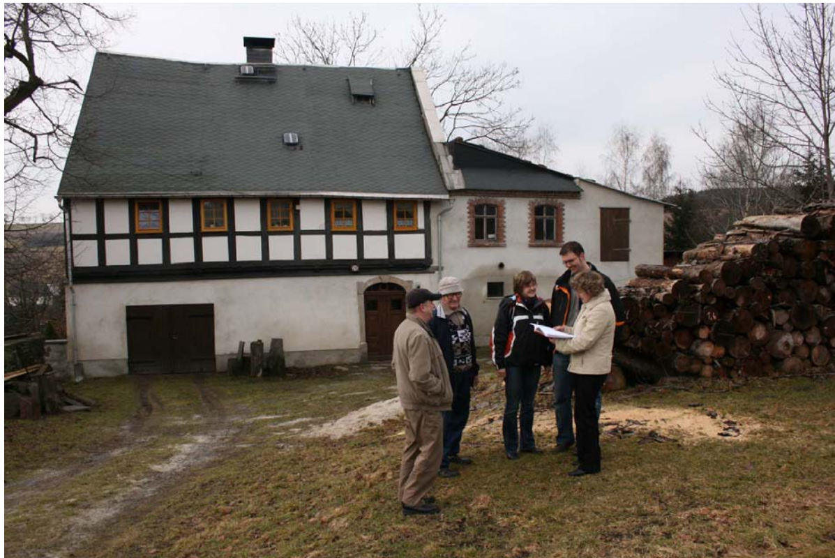
Maßnahme-Besprechung vor Ort

Informationsveranstaltung ILE 26.05.2008