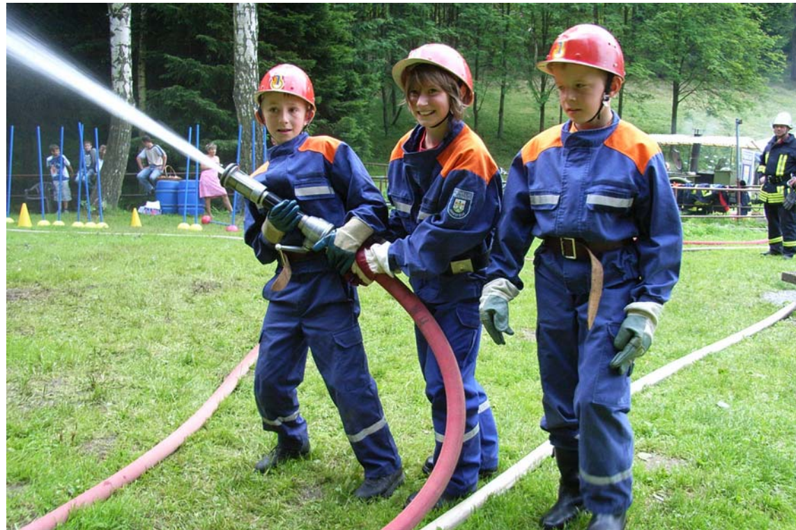
Nachwuchs aktiv einbinden