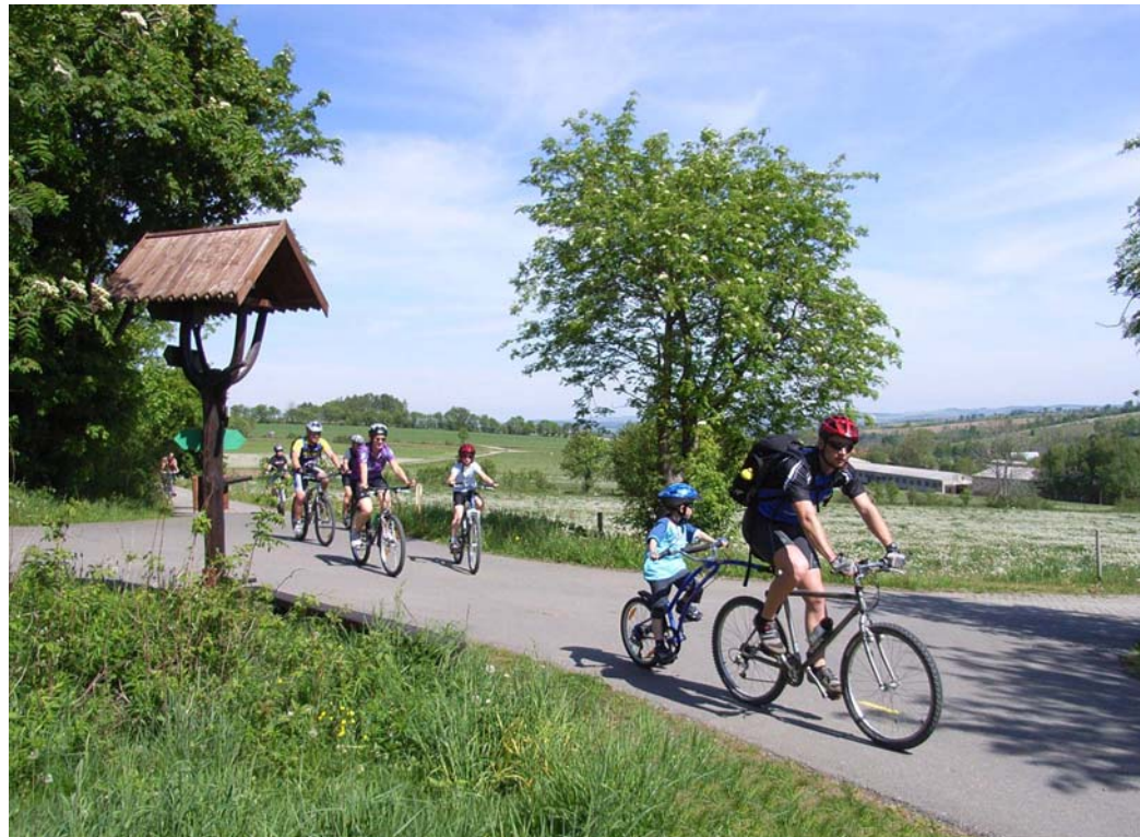
Das Annaberger Landring Radeln

Informationsveranstaltung ILE 26.05.2008