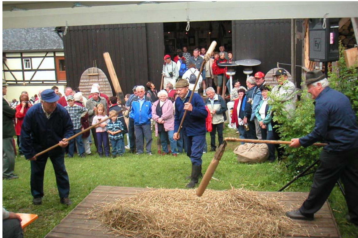
Hoffest am Zielpunkt der Sternwanderung

Informationsveranstaltung ILE 26.05.2008