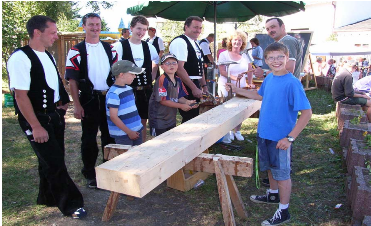
Handwerker in Dorffeste einbinden

Informationsveranstaltung ILE 26.05.2008