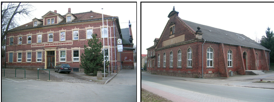
Abbildung 2: Aufnahmen vom Kultur- und Schützenhaus Penig von 2004

immer gesichert ist. Andererseits können auch die dezentralen Einrichtungen nicht die Funktionen der größeren zentralen Einrichtungen übernehmen. Der Einsatz der begrenzten Haushalts- bzw. Fördermittel erfordert daher viel Augenmaß seitens der Kommune.