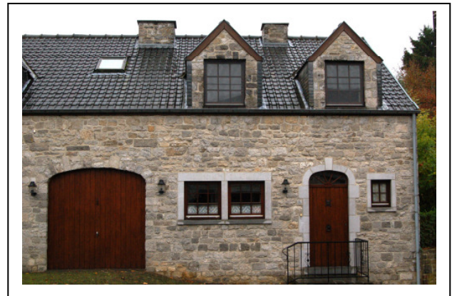
Alt- und Neubau in Crupet