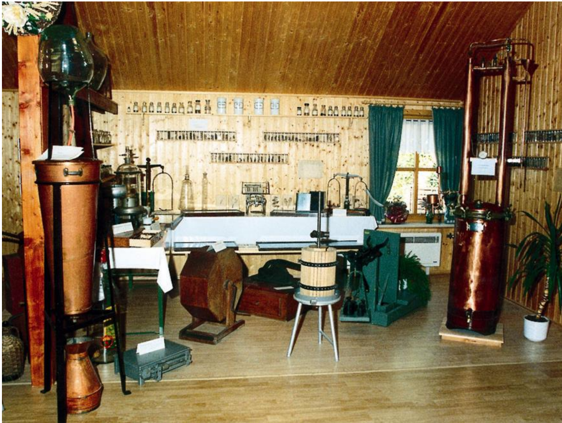
Erstes Spirituosenmuseum Sachsens