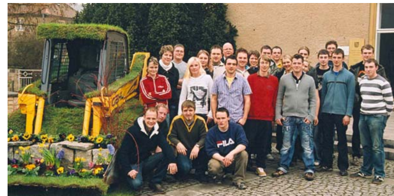
Projektarbeit der Klasse „Wirtschaftler Gartenbau“ 2009

Interessierte können sich durch Unterrichtsbeispiele und in Führungen von den ausgezeichneten Studienbedingungen überzeugen. Dazu gehören auch die preisgünstige Unterbringung im Wohnheim, die Mensa und die umfangreiche Fachbibliothek vor Ort.