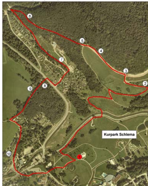
Wegeübersichtsplan und Standorte der Info-Tafeln