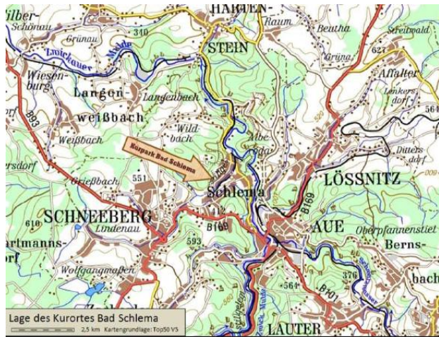
Der Rundgang beginnt im Kurpark Bad Schlema