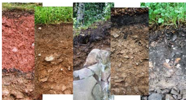
Profile des Bodenlehrpfades

Der Bodenlehrpfad in Bad Schlema zeigt Böden, die stark vom Bergbau geprägt wurden. Der ca. 3 km lange Rundweg führt durch eine abwechslungsreiche junge Bergbaufolgelandschaft, die für ihre Erzlagerstätten bekannt ist. An fünf Bodenprofilen wird die „Haut der Erde“ mit ihren vielseitigen Funktionen und Eigenschaften beschrieben und erklärt. Auf gut begehbaren Wegen, begleitet vom Symbol des kleinen Maulwurfs, lernen die Besucher das sonst so verborgene Innenleben der Böden kennen.