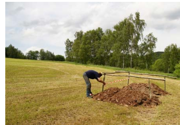
Entstehung des Bodenlehrpfades im Juni 2010