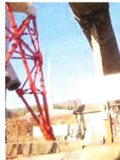
Cos de dispersie la SC Romplumb SA Baia Mare

Este de subliniat faptul că ne confruntăm cu o situație de poluare istorică, pentru a cărei diminuare și eliminare sunt necesare eforturi uriașe. Metalele, prin proprietățile lor chimice și fizice, sunt elemente nedegradabile în natură, care migrează cu ușurință prin transformari repetate în toți factorii de mediu.