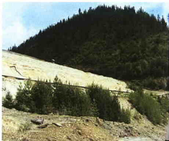
Iaz de decantare Colbu – zona Borsa

Este de subliniat faptul că ne confruntăm cu o situație de poluare istorică, pentru a cărei diminuare și eliminare sunt necesare eforturi uriașe. Metalele, prin proprietățile lor chimice și fizice, sunt elemente nedegradabile în natură, care migrează cu ușurință prin transformari repetate în toți factorii de mediu.