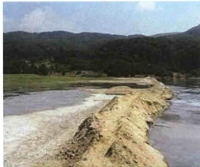
Iazul de decantare Plopiș- Răchițele, Cavnic

Reconstrucție ecologica a zonelor afectate constă din amenajarea și punerea în siguranța a depozitelor de deșeuri în urma închiderii acestora, prin operațiuni care necesită un volum mare de investiții, soluții și lucrări speciale pentru asigurarea stabilității și punerii în siguranța a depozitelor.