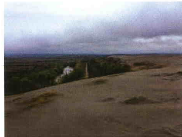
Iazul de decantare Bozânta

În consecință au început procedurile de reglementare din punct de vedere al protecției mediului, proceduri care continuă și astăzi, pentru închiderea perimetrelor miniere, a haldelor de steril de mină, a uzinelor de preparare și a iazurilor de decantare, precum și pentru reconstrucția ecologică a zonelor afectate. Sunt inventariate în județul Maramureș 17 iazuri de decantare nefuncționale și neconforme, aproximativ 300 halde de steril de mină și 8 depozite de pirite arsenioase.