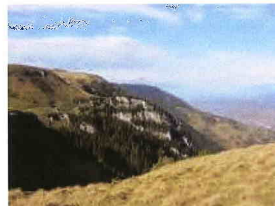
Rezervația de cocoș de mesteacăn Cornu Nedeii - Ciungii Bălăsânii - Borșa