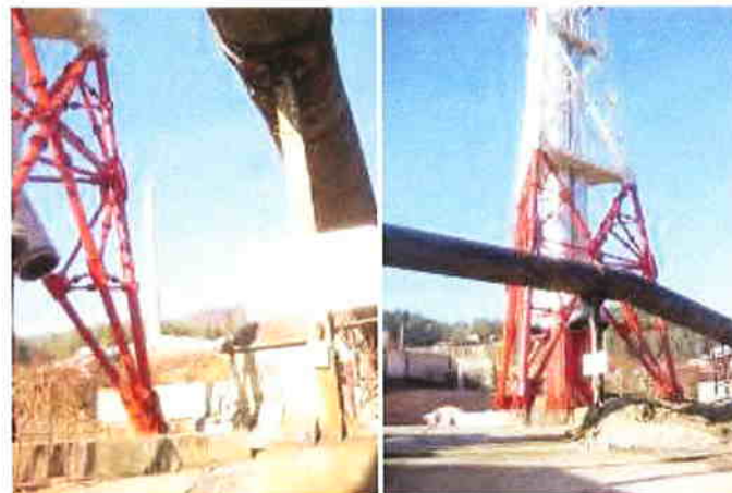
Coșul vechi și coșul nou de dispersie

SC ROMPLUMB SA Baia Mare deține Autorizația Integrată de Mediu nr. 97NV/01.11.2007 cu Plan de acțiuni, emisă de Agenția Regională pentru Protecția Mediului Cluj-Napoca, pentru activitatea de producere a plumbului decuprat.