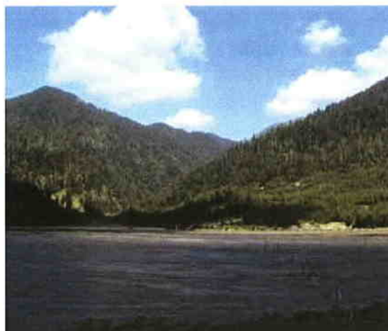
lazul de decantare Novăț, Borșa