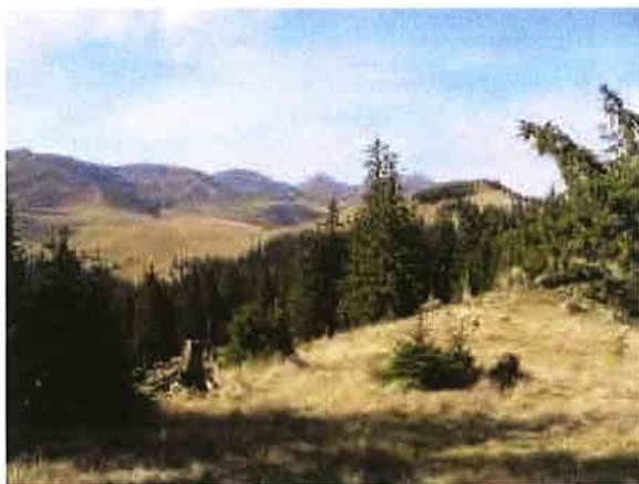
Creasta Munților Rodnei

Județul Maramureș are un patrimoniu natural deosebit de valoros, constând în 39 de arii naturale protejate (35 de interes național și 4 de interes local), din care 1 parc național – Parcul Național Munții Rodnei – Rezervație a Biosferei și 1 parc natural – Parcul Natural Munții Maramureșului, suprafața ariilor naturale protejate fiind de 1596,07 km 2 , reprezentând aproximativ 25% din suprafața județului.