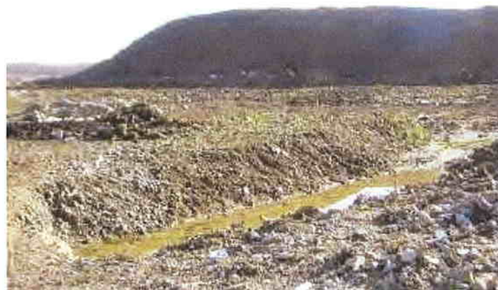
Depozitul de deșeuri menajere – Satu Nou de Jos, Baia Mare

Depozitele din mediul rural trebuie închise și ecologizate în anul 2009, conform prevederilor legale.