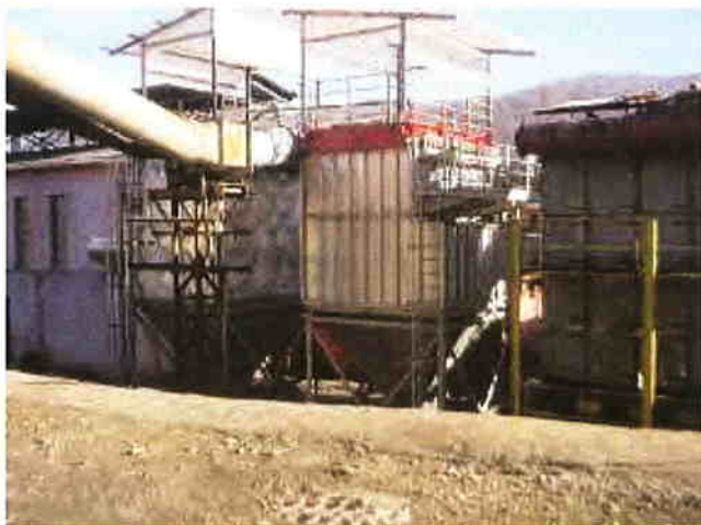
Modernizarea sistemelor de filtrare

Până la această dată au fost realizate măsurile la termenele scadente, prin implementarea proiectului “Creșterea siguranței în funcționare, îmbunătățirea mediului de muncă și ecologizare activităților tehnologice la secția Topire – Rafinare, la S.C. Romplumb S.A. Baia Mare”, constând în lucrări la secțiile de depozitare materii prime, aglomerare, topire, vizând în principal încadrarea în valorile limită admise a concentrațiilor de pulberi în emisiile la coșul de dispersie. A fost inițiată procedura în vederea realizării unei instalații de reținere a \text{SO}_2 din gazele tehnologice de la secția aglomerare-topire, cu termen de finalizare 31.12.2009.