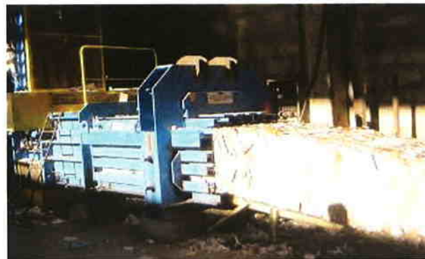
Colectare deșeurilor de hârtie la SC REMAT SA Baia Mare