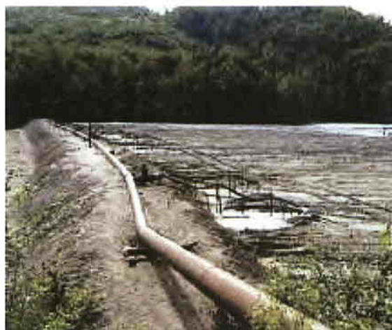
lazul de decantare Bloaja, Băiuț