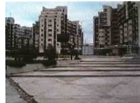
Stația de monitorizare MM2 – fond urban