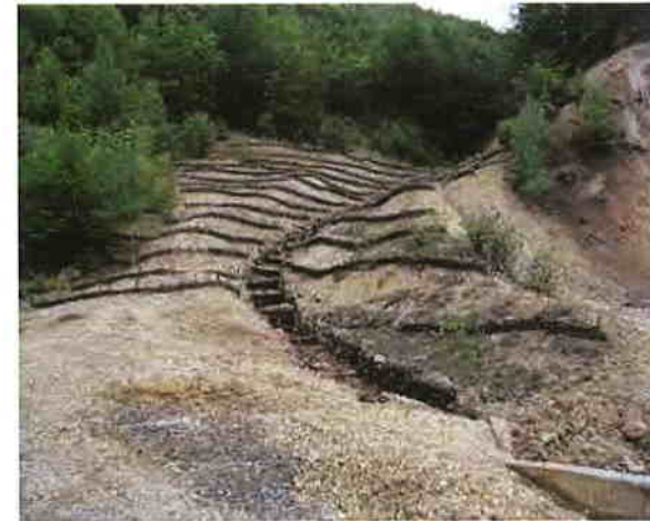
Halda de steril de mină Anton II, Băița