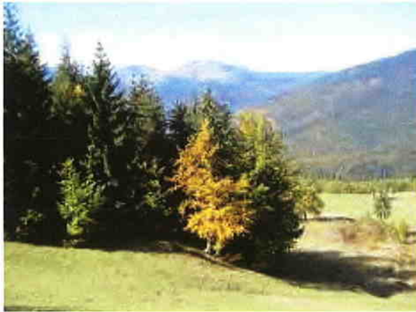
Masivul Pop Ivan – Munții Maramureșului

În județ sunt declarate 8 Situri de Interes Comunitar (SCI-uri): Arboretele de castan comestibil de la Baia Mare, Defileul Lăpușului, Gutâi – Creasta Cocoșului, Zonele umede de pe platoul Igriș, Munții Maramureșului, Munții Rodnei, Tisa Superioară și Valea Izei, Dealul Solovan) și 1 Sit de Protecție Specială Avifaunistică (SPA): Munții Rodnei ca părți integrante ale Rețelei Ecologice Europene Natura 2000 în România.