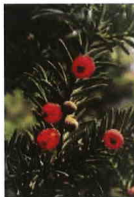
Tisa - monument al naturii