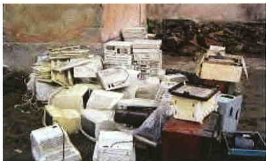
Colectare DEEE la Sighetu-Marmației

Sunt monitorizate activitățile de implementare a directivelor Uniunii Europene în domeniu, privind incinerarea deșeurilor, utilizarea în agricultură a nămolurilor din stațiile de epurare, colectarea și gestionarea deșeurilor de echipamente electrice și electronice și a vehiculelor scoase din uz, a uleiurilor uzate și a bateriilor și acumulatorilor cu conținut de substanțe periculoase, privind prevenirea și reducerea poluării cu azbest. Sunt supravegheate și controlate transporturile de deșeuri.