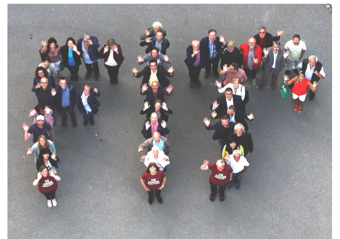
11.08.2021 - Auftaktveranstaltung am Spiegelwald in Grünhain-Beierfeld, regionale Akteurinnen und Akteure bilden den Schriftzug F.I.T.