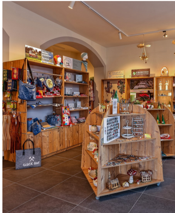
Regionales in Eibenstock - Gemeinschaftsladen, der Bevölkerung und Gästen ein innovatives Einkaufserlebnis bietet und als Netzwerk regionale Hersteller bündelt.

Strategisches Ziel der Gesamtentwicklung ist, die Region unter Nutzung der regionalen Potenziale und Traditionen als zukunftsorientierten, leistungsstarken und innovativen Lebens- und Wirtschaftsraum so zu entwickeln, dass die Einzigartigkeit von Natur und Landschaft geschützt wird und die hohe Lebensqualität für alle Generationen und gesellschaftlichen Gruppen gewahrt bleibt.